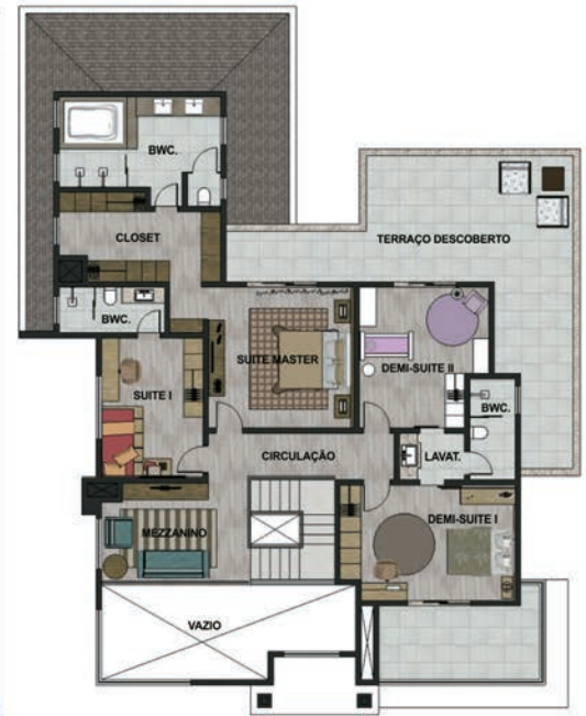
PLANTA DO PAVTO SUPERIOR ÁREA 140,35m 2