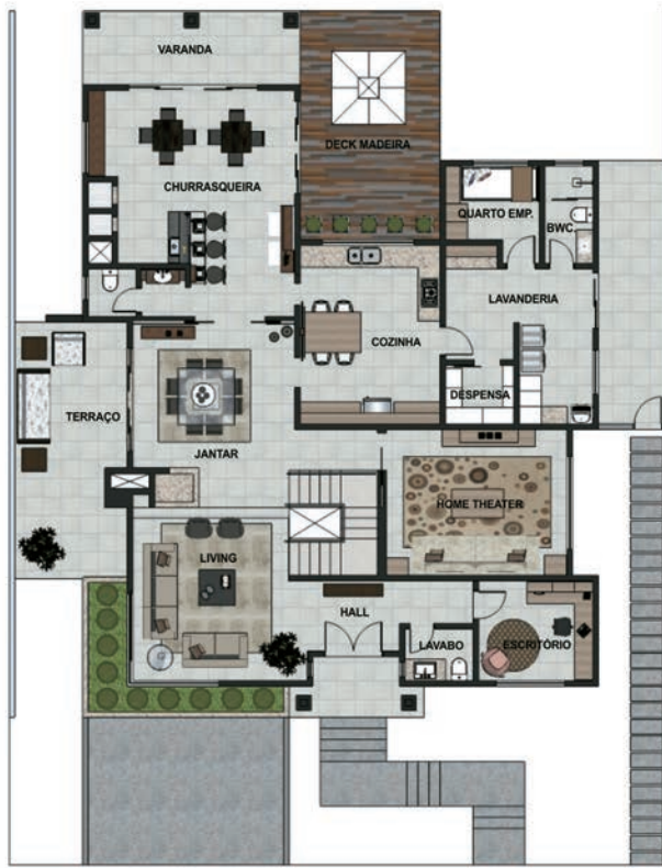
PLANTA DO TÉRREO ÁREA 199,12m 2